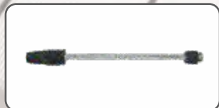
Lanca Regulowana S-98923