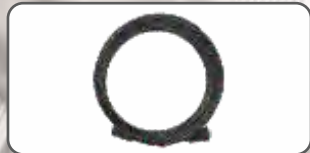
Wąż Wysokociśnieniowy w Oplocie Stalowym 8 m S-98941