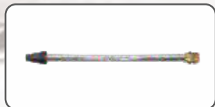
Lanca Turbo S-98925