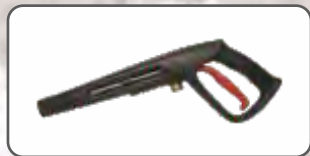
Pistolet z mosiężnym złączem S-97929

Czyści do 40% szybciej niż standardowa dysza. Silny obrotowy strumień skutecznie usuwa brud ze stałych, twardych powierzchni. Wkład dyszy wykonany z ceramiki oraz mosiężne złącza zapewniają jej długą żywotność i bezawaryjną pracę.