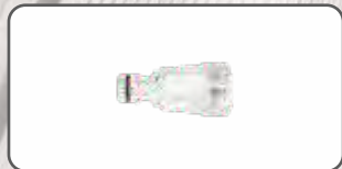
Filtr wody S-97930