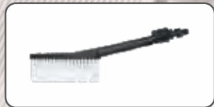
Szczotka Uniwersalna S-97922